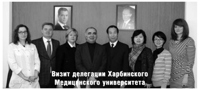
Визит делегации Харбинского Медицинского университета