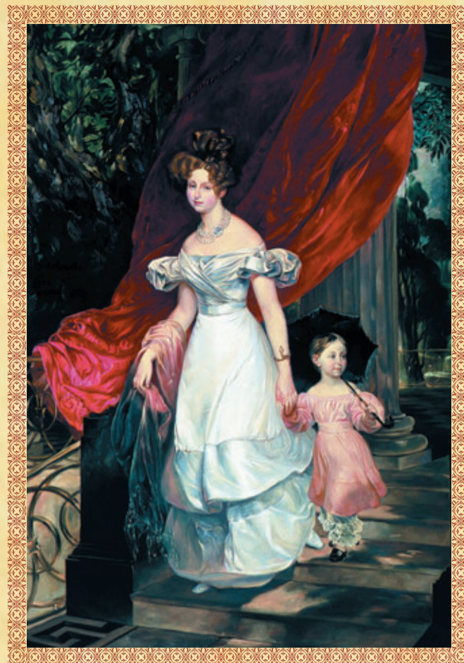
К.П.Брюллов. Портрет Великой княгини Елены Павловны с дочерью Марией. Холст,масло, 1830. ГРМ

Великая княгиня Елена Павловна (1806-1873)