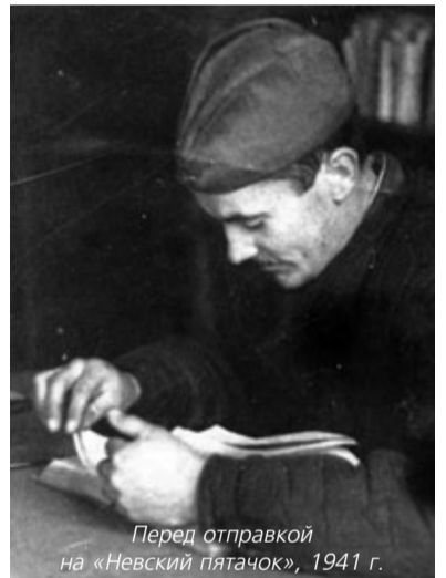
Перед отправкой на «Невский пятачок», 1941 г.